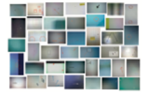
Penelope Umbrico (US) Broken Sets: Bad Displays

Quand un logiciel défectueux régit l'assemblage d'une série de photographies prises à Madrid. Was passiert, wenn eine fehlerbehaftete Software die Zusammenstellung von in Madrid aufgenommenen Foto- serien übernimmt?