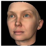
Heather Dewey-Hagborg (US) Radical Love: Chelsea Manning

Une installation interactive pour explorer le potentiel érotique d'un simple geste. Eine interaktive Installation, welche das erotische Potenzial einer einfachen Geste auslotet.