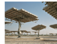
Etienne Malapert (FR/CH) The city of possibilities

Collection d'étranges rebuts d'impressions 3D ratées. Sammlung von eigenartigem Ausschussmaterial aus misslungenen 3D-Drucken.