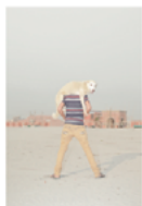
Farhad Rahman (BD) One Last Playground

2013, construction du barrage Spring Grove en Afrique du Sud. Un travail documentaire sur les limites de la photographie au regard de la mémoire. En collaboration avec Joburg Photo (ZA) . 2013. Bau des Staudamms Spring Grove in Südafrika. Eine dokumentarische Arbeit über die Grenzen der Fotografie im Angesicht des Erinnerens. In Zusammenarbeit mit Joburg Photo (ZA) .