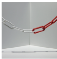
Classe professionnelle de graphisme 2 e année 2. Fachklasse Grafik

Travail d'un semestre sur le thème «Permis de construire». Semesterarbeiten zum Thema «Permis de construire».