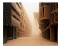
Etienne Malapert Sandstorm

tiré de la série aus der Serie «The city of possibilities» 2015 Fine Art Print, Baryt Pearl 21 x 26 cm