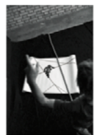
Simone Haug (CH) Acrobates!

Mandatées par le Pôle de recherche national LIVES et les Journées photographiques de Bienne, trois jeunes photographes suisse ont réalisé chacune un travail sur les théma- tiques du PRN LIVES «vuln- érabilité et résilience». Im Auftrag des Nationalen Forschungsschwerpunkts LIVES und der Bieler Fototage haben drei junge Schweizer Fotografinnen je eine Arbeit zum Thema des NFS LIVES «Vulnerabilität und Resilienz» realisiert.