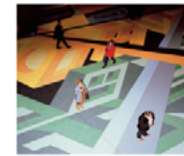
Aras Gökten (DB) Arkanum

Ascenseurs, lot de villas, transports publics: quelques arcanes des non lieux d'aujourd'hui. Aufzüge, Villengrundstücke, öffentlicher Verkehr: ein paar Geheimnisse von heutigen Unorten.