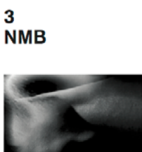
Melanie Cassidy / Michael Filimowicz / Andres Wanner (CA/CH) Cursor Caessor Eraser

Le paysage se densifie au rythme de constructions incessantes. Où joueront les enfants de demain? En collaboration avec Goa Photo (IN) . Die Landschaft wird im Rhythmus der unablässigen Bautätigkeit zubetoniert. Wo werden die Kinder von morgen noch spielen können? In Zusammenarbeit mit Goa Photo (IN) .