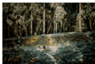
Matt Kay (ZA) Losing Ground

Une valise trouvée sur le trottoir mène à vider son sac. En collaboration avec Fotopub (SO) . Ein auf dem Trottoir gefundener Koffer führt zu einer kritischen Betrachtung des eigenen Selbst. In Zusammenarbeit mit Fotopub (SO) .