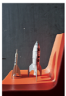
Robert Ormerod (GB) International Rocket Week

Une fois par an, l'International Rocket Week réunit des passionnés d'aéronautique sur la lande écossaise. Einmal pro Jahr kommen im schottischen Hochland anlässlich des International Rocket Week Flugbegeisterte zusammen.