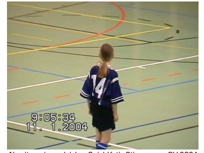
Abseits – ein ungleiches Spiel, Katja Stirnemann, CH 2024