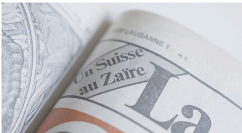
The Right to Forget, Lisa Mazenauer, CH 2025